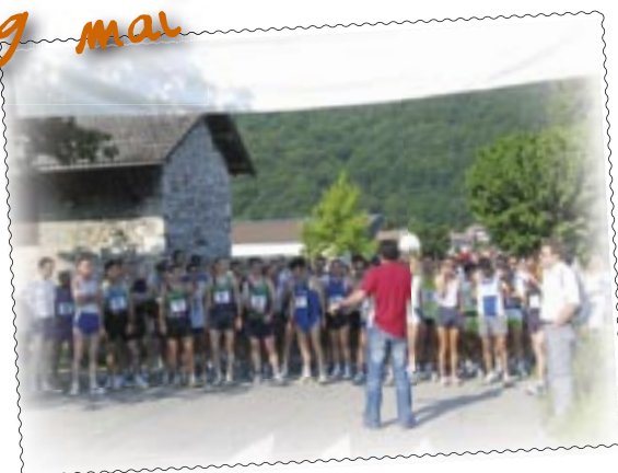
Montée d'Ezy : "prêt...partez !"