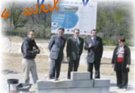
La première pierre de l'EHPAD

La période estivale est toujours pour chacun d'entre nous une trêve bienvenue ; l'occasion de faire aussi le point sur le travail accompli au cours des premiers mois de l'année. 2005 est une année décisive, concrétisant le lancement d'importants projets pour notre commune. Ainsi, le projet architectural de la nouvelle école maternelle a été arrêté par le conseil municipal le 17 mars dernier, et les travaux qui débuteront en septembre prochain seront achevés avant la rentrée 2006. Dans le parc des Biches, après l'aménagement du réseau d'eau en mai, le bâtiment de l'EHPAD va, lui aussi bientôt sortir de terre : après la pose de la première pierre, l'installation récente de la grue permet la mise en route des importants travaux de gros œuvre. Avec cet équipement nous allons pouvoir offrir à nos anciens un cadre exceptionnel pour traverser cet âge de la vie dans les meilleures conditions. C'est une réalisation qui me tient particulièrement à cœur, peut-être parce que j'ai grandi ici et partagé ma vie avec ceux qui sont aujourd'hui nos aînés et pour qui j'ai toujours eu beaucoup de respect.