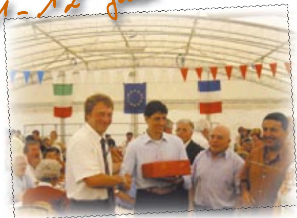
Merone : en toute amitié