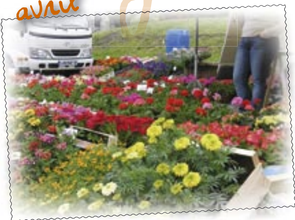
Floréart 2005 : parterre fleuri