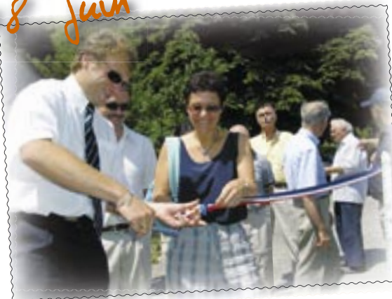
Inauguration du chemin de la Touvière