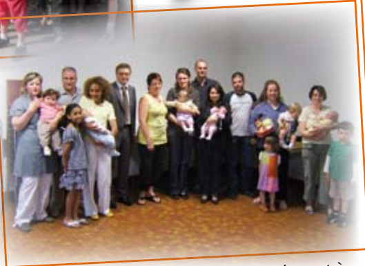
Fête des mères. Les mamans de l'année sont à l'honneur et reçoivent en cadeau, une corbeille de produits de beauté.