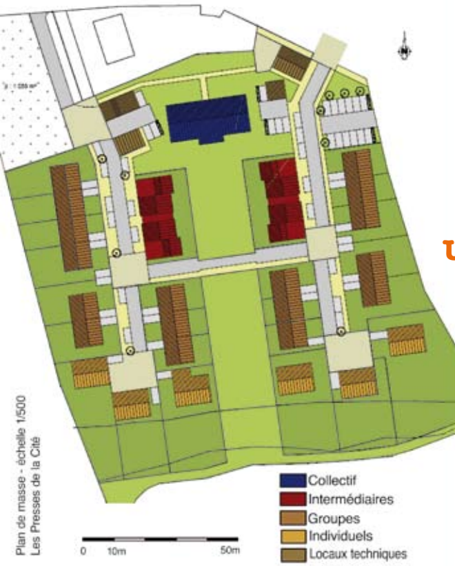
Plan de masse - échelle 1/500 Les Presses de la Cité

40 nouveaux logements à Noyarey. Le projet d'aménagement du terrain Oddos se concrétise. Concertation et négociation auront permis de faire aboutir un projet complexe mais qui répond à d'importants enjeux. Les précisions du maire, Denis Roux.