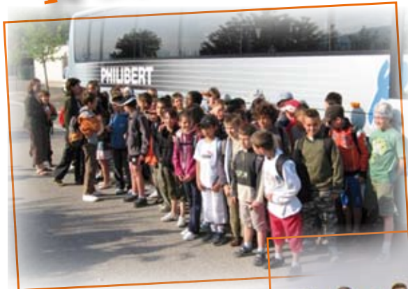
Classe de mer. Les enfants de l'école partent pour Fréjus, où ils séjournent neuf jours.