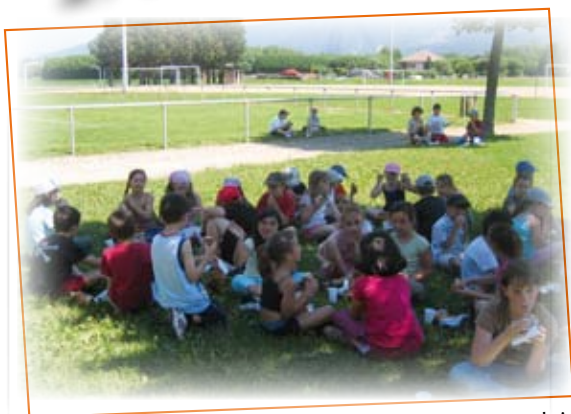
Cantine buissonnière. Les enfants du restaurant scolaire participent à un pique-nique au stade. Après le repas, les enfants découvrent de nombreux petits jeux.