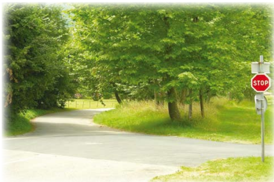
Le carrefour d'accès au lotissement du Manoir.

Cinq points sensibles ont été traités dans le cadre de l'entretien du réseau : place Victor Jat, le bas de la rue Léon Porte, le carrefour de la route de la Vanne et de la RD 1532, Chemin de Chaulnes où a été aménagée une aire de retournement pour le camion de collecte des ordures ménagères ainsi que l'entrée du lotissement du Manoir. 30 000 € ont été investis par la commune pour réaliser ces travaux de reprise de l'enrobé sur des zones détériorées. Le marquage au sol terminera ces travaux.