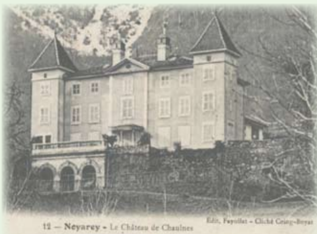
12 - Noyarey - Le Château de Chaulnes

Pour plus de renseignements contactez les services de la mairie au 04 76 53 82 01.