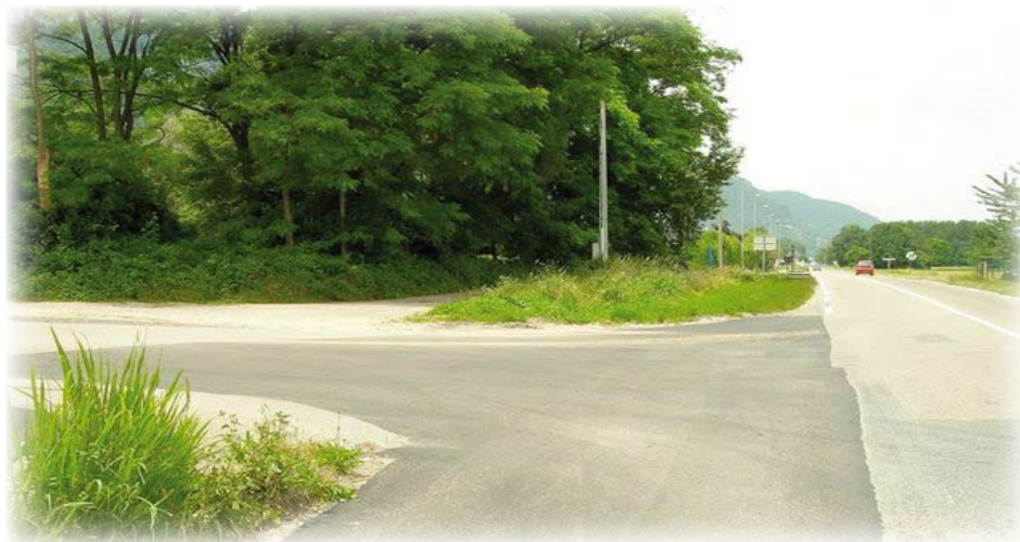
Le bas de la rue Léon Porte et la RD 1532.